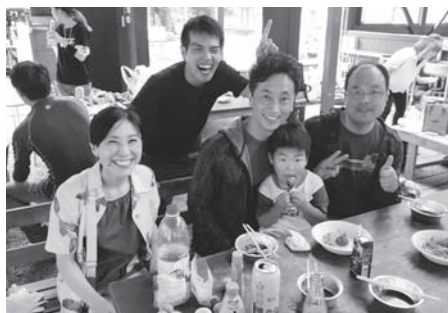
(支所間交流会にて)