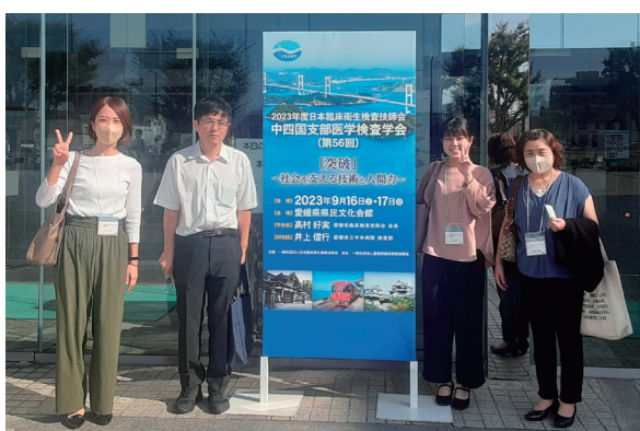
(令和5年中四国支部医学検査学会)