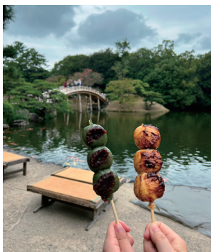
(吹上亭の焼き団子)

公益財団法人結核予防会より、結核研究奨励賞候補者推薦依頼が届きました。つきましては、結核に関する優れた調査研究について、原則として過去3年以内に学会、研究会、雑誌等に発表された方がおいでましたら当会事務局までお知らせください。