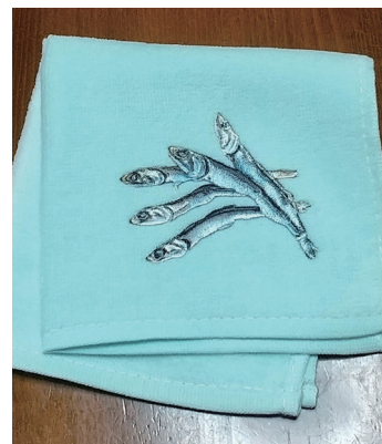
(超リアル！イリコの刺繍タオル)

9月に入り、朝晩少し過ごしやすくなりました。先日、私はまた栗林公園に行ってきました。見頃の花も少なく、紅葉でもない“グリーン庭園”でしたが、人のいない景色を独り占めできて、お茶やお団子など頂いて、のんびり過ごせました。今月末には食事とコンサートの観月会があるようです。お土産売り場にも面白いものがありましたよ。この秋は人々の交流が増えてきて、香臨技でも健康フェスタ、新(再)入会研修会、検査と健康展と対面の行事が続きます。学会など現地に参加される方も多いと思いますが、コロナ期の教訓を活かして感染対策も忘れずに活動したいですね。