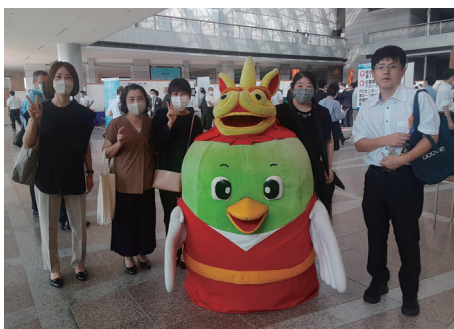
(来年は鳥取県で開催されます(トリピー))

学会に参加することは、勉強をする事だけでなく、発表をする事により検査技師の面白みを感じ、何より同分野だけでなく、他分野の人と関わりができて大きな財産となります。来年は鳥取県で中四国支部医学検査学会が11月2、3日、とりぎん文化会館で開催されます。皆様も是非参加してみてもは如何でしょうか？